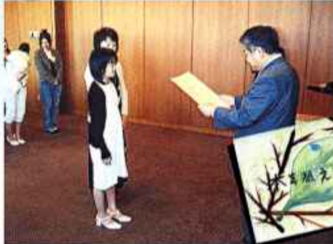
上田市長から表彰状をいただきました!