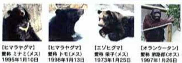
【ヒマラヤグマ】愛称 ミナミ(メス) 1995年1月10日 【ヒマラヤグマ】愛称 トモ(メス) 1998年1月13日 【エゾヒグマ】愛称 栄子(メス) 1973年1月25日 【オランウータン】愛称 弟路郎(オス) 1997年1月26日