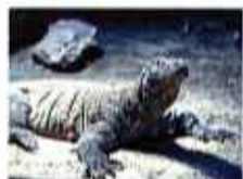
【コニ】メス・6歳 全長180cm 体重23Kg コナンと同じく動物園生まれ。やや神経質ですが、野生のものにとくらべると、とても温和。