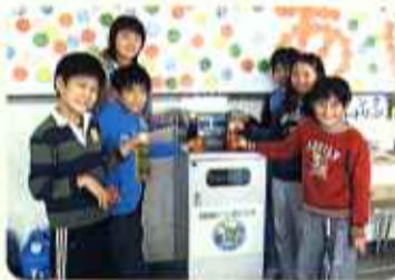
子供達と回収ボックス