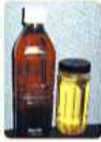
廃油とバイオマス燃料

家庭で出た天ぷら油(廃食油)をどう していますか?今回は二十四軒小学校 での取り組みをご紹介します。