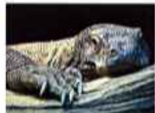
【コナン】オス・6歳 全長228cm 体重54.5Kg 動物園生まれで人になれています。種やかで落ち着いた気性。

もうご覧になりましたか?昨年11月からインドネシアから借り受けた、世界最大のトカゲ「コモドオオトカゲ」の展示を行っています。このコモドオオトカゲはコモド・ドラゴンとして知られ、特にインドネシアのコモド島やフローレス島、リンチャ島などにすむ、コモドオオトカゲが世界最大といわれています。残念ですが今年の夏までの限定展示なので、コモドオオトカゲの大きさを実感したい人は忘れずにネ。