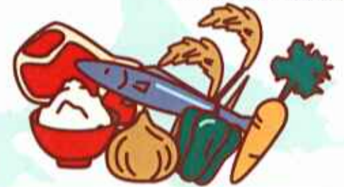
資料提供：札幌市保健福祉局

北海道の食料自給率は200%! 日本の食料基地とまで言われ、 いろいろな食べものがそろっています。 これらのものをバランスよく食べることが 健康への第一歩です。