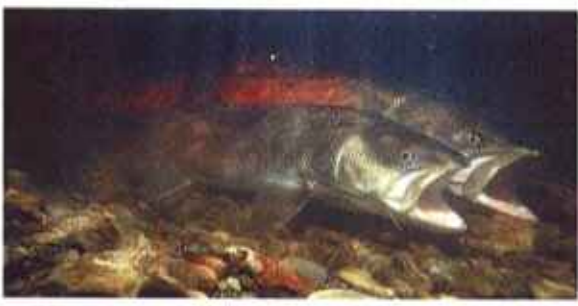
イトウの産卵。他のサケ類と違い春に産卵する。からだが高っ赤に染まっているのがオス。