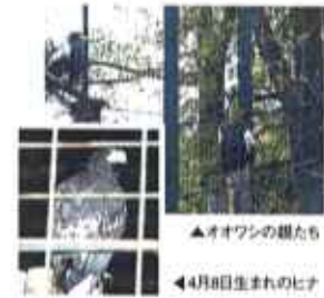
▲オオワシの雛たち

4 月8日生まれのオオワシは、体はほぼ親並みにまで育ちました。止まり木にのったままの親たちと違って活発にちょこちょこ動き回っています。