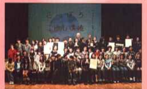
札幌市環境局・札幌市教育委員会