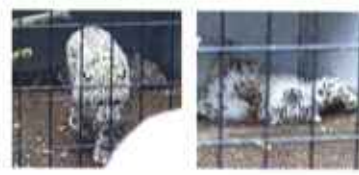
◀左:カメ目録のヤマト(オス)と右:超リラクスモードのユッコ(メス)

体 は大きくなったけど、いまでも一生懸命に遊んで一生懸命眠るホッキョクグマ・ツインズ。