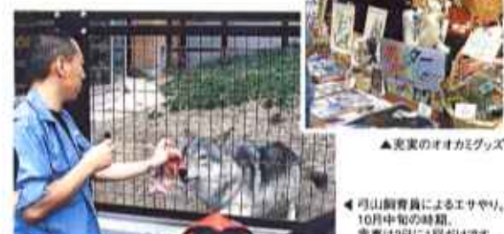
▲充実のオオカミグッズ