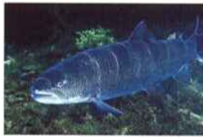
▲尻別川産のイトウ