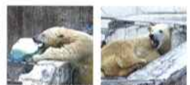
▲観用に遊ぶキヨル ▲お眠りのイコロ

体 は大きくなったけど、いまでも一生懸命に遊んで一生懸命眠るホッキョクグマ・ツインズ。