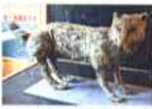
▲絶滅したエゾオオカミのはく製

会場には、約百年前に絶滅したエゾオオカミのはく製も展示されていました。アイヌの人たちが北海道の森の神と崇められていたエゾオオカミ。そのエゾオオカミがいない今、エゾシカの増えすぎが問題になっています。 円山動物園のキナコ(メス9歳)とJ(オス4歳)の元気な姿を見ながら、もし彼らが近くの森にいたらどんなだろうと想像してしまいました。