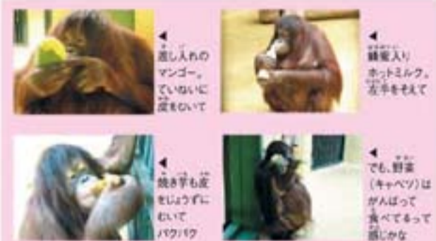
◀ 差し入れのマンゴー。でいかに皮もついて