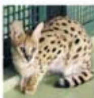
▲成獣で体長70〜100cm、体重8〜18kgとスリムです

南 アフリカ共和国から推定4歳のサーバルキヤットの娘がやって来ました。サーバルキヤットはアフリカのサバンナの水辺に生息する、足が長く耳が大きいネコ科動物。すごいのはそのジャンプ力で、3mほど飛び上がり、飛んでいる鳥をとることもあるのだとか。そのジャンプを円山でも見せてくれるといいね!