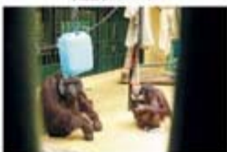
▲ 弟路郎(雄)も大好きな蜂蜜入りヨーグルトをひとりで飲むレンボー(雌)。それを良守を羨ましい顔で。レンボーに赤ちゃんができたら、君もバババ!