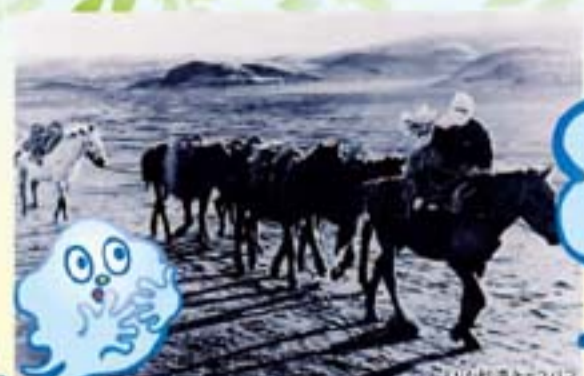
昭和初期、えりもの海岸は「砂漠」だった

日高山脈の南端、太平洋に突き出す岬がえりも岬だ。その岬から北東にのびる百人浜がかつて「えりも砂漠」と呼ばれていた場所だ。なぜ「砂漠」なのか？ 写真をよく見てごらん、馬に乗った