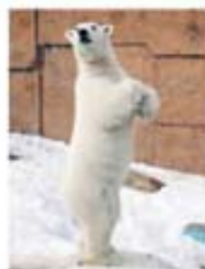
▲2本足で立ち上がるのがピリカのくせ。首のゆりも楽しく!