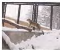
スペースが広くなり、岩や木に登る様子も見られます