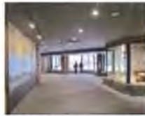
アジアゾーンの室内から、ユキヒョウを近くに見ることが出来ます

美しい毛皮が原因で絶滅の危機にあるユキヒョウ。ユキヒョウは、ヒマラヤなど標高2000〜6000メートルの山岳地帯に棲んでいます。美しく密な毛皮を持つため、山岳地帯の厳しい寒さに耐えることができます。ですが、その毛皮を目的とした密猟などが原因で絶滅の危機に瀕しており、現在世界でも7000頭ほどしかいないと言われています。そのため、ワシントン条約でその取引が禁止されるほか、国際自然保護連合(IUCN)でも絶滅危惧種に指定されています。生息地での保護活動や世界中の動物園での繁殖の取り組みが行われています。日本には、9つある動物園に24頭のユキヒョウが飼育されていますが、そのうち4頭が円山動物園で暮らしています。1987年に日本で初めてユキヒョウの繁殖に成功したのが円山動物園です。