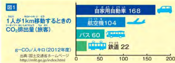
図1にあるように、1人が1km移動するときのCO 2 排出量は、移動手段によって違うもの。状況に応じて、CO 2 排出量が少ない移動を選べば、環境にもやさしいよね。また、通学や通勤のときに徒歩や自転車を使うと健康にもいいし、仲間と楽しい時間を過ごせるチャンスが増える。旅行など、長距離の移動は公共交通機関を使うと便利で、快適なことが多いんだって。もちろん、車で