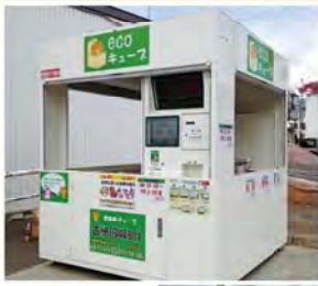
省スペースタイプのエコ・ステーション

「古紙リサイクルポイントシステム」とは、市内のスーパーに設置されたエコ・ステーション