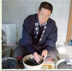
花火玉の名乗ることが出来ます。

「花火師」とは、主に花火大会などで打ち揚げる花火の製造から、打ち揚げまでを手掛ける人。実はこの「花火師」という呼び名は通称です。正式には「煙火打揚従事者」といい、「公社」日本煙火協会に認定を受けた人・団体だけがその