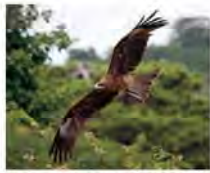
翼を広げながら、輪を描くように優雅に飛びます。

街中にも見られる 最も身近な猛禽類 トビは、北海道や本州、九州の海沿いや川原、街中で見られる、とても身近な猛禽類です。「トビヒヨロ」と鳴きながら、ほとんど羽ばたかずに、風に乗ってゆったりと飛びます。猛禽類はオスよりもメスの方が大きく、メスの翼は広げると150cmほどにもなります。体の色は茶色と白のまだら模様。雌も美しい茶褐色です。とび色という茶褐色を表す日本の伝統色がありますが、これはトビの色から来ています。トビは人間の約8倍の視力を持つと言われており、飛びながら遠くの顔を見つけると、急降下してつかみ取ります。主に動物の死骸や、カエルやトカゲなどの小動物を食べ、都市部では人間のミヤや食べ物を狙うこともありますが、ほとんどの顔を見つけては、1日に4羽ずつ与えています。自然界では、天候などによって全く獲物を捕らえられない日もあるため、餌を与えない日も設けているそうです。