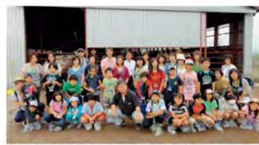
近くで牛を見るのが初めてという人も多く、大きさに驚いていました。