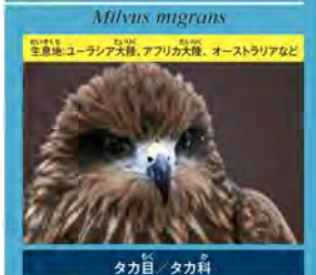
タカ目 / タカ科