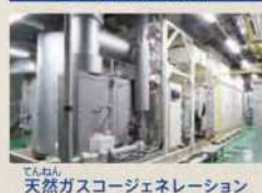
天然ガスコージェネレーション