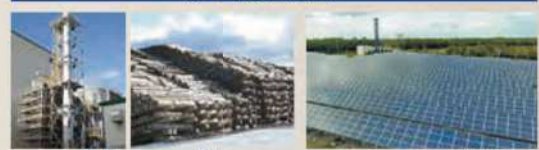
苫小牧バイオマス発電