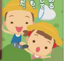
監修：札幌市環境局 環境都市推進部 環境管理担当課

みんなが住む札幌には、山や森がたくさんあるよね。そこには、さまざまな野生動物が生息しているよ。中でも、ヒグマはとても危険な存在。でも、よく知ることが事故を防ぐことができるんだ。今回は、そんなヒグマのことを紹介するよ。