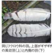
同じアークロウ科の羽。上部がギザギザの風切羽(上)と内側の羽(下)