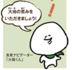
食育ナビゲーター「大福くん」

野菜は、体の調子を整えるビタミンやミネラル、腸の働きを良くする食物繊維が豊富です。それらの栄養素と働きを、表1でくわしく見てみましょう。