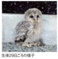
生後29日ごろの様子