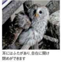
耳にはふたがあり、自在に開け閉めができます

「飼育員さんへの質問」を受け付けているよ!聞きたいことを送ってね!応募方法は10ページを見てね。