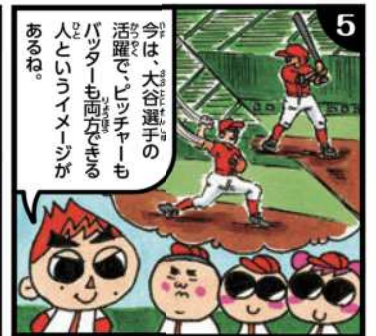
イラスト:こじま ゆき