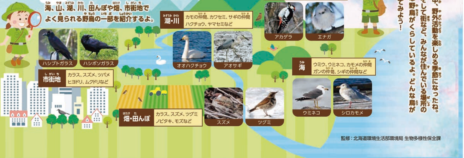
図2. 身近な場所で、どんな野鳥が見られるかな?