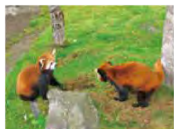
背の中側は茶色、お腹や足は黒色

「パンダ」 竹を食べるもの レッサーパンダは中国南部やインド、ネパール、ミャンマーなどの標高が高い山地や森林にすむ、小型のほ乳類です。パンダといえば、上野のジャイアントパンダが有名ですね。「パンダ」とはネパール語で「竹を食べるもの」という意味で、ジャイアントパンダもレッサーパンダも竹の葉を主食とします。ジャイアントパンダはクマ