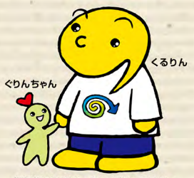
北海道リサイクル イメージキャラクター