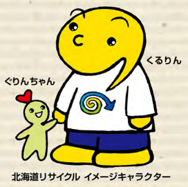
北海道リサイクル イメージキャラクター