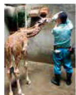
飼育員があたえるミルクを飲むコハク

生まれてすぐにあたえていたのは、牛の初乳です。初乳とはお母さんが赤ちゃんを産んだ直後に出すミルクで、免疫成分やタンパク質を多く含む病気に打ち勝つ強い体を作るために必要なものになりました。