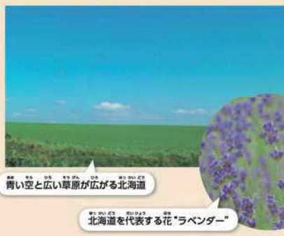
青い空と広い草原が広がる北海道