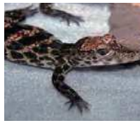
ニシアフリカコガタワニの子ども

ワニは水辺で暮らす、虫類の仲間、世界の暖かい地方に生息する24種が生息しています。ニシアフリカコガタワニは、アフリカ西部、中央部の森の中にある小川や沼などで暮らしています。ワニとしては小型で、全長の約半分の長さを占めます。このワニは肉食で、野生では魚、カニ、カエルやオタマジャクシなど、水辺の動物を食べています。