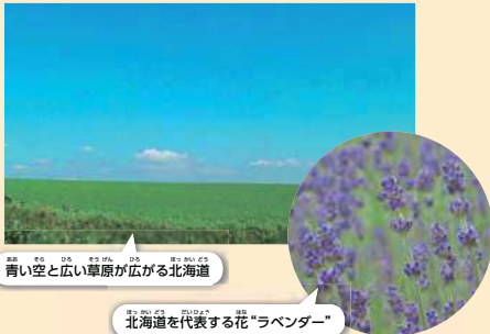
青い空と広い草原が広がる北海道 北海道を代表する花「ラベンダー」

どこまでも続く草原や、ずっとのびる1本道を、キミは見たことがあるかな? 日本の最も北に位置する北海道には、そんな雄大な景色が広がるよ。夏の日中は30度近くなることもあるけれど、夜はすっと気温が下がるから、とってもさわやか。そして、その寒暖差があるからこそ、野菜をはじめ、米や麦、ソバや大豆、乳製品など、たくさんのおいしい食べ物を作ることができるんだ。 自然や農業を体験しながら休暇を過ごすことを「アグリツーリズム」というよ。聞いたことはあるかな? 北海道では、さまざまな「アグリツーリズム」が体験できちゃうんだ!