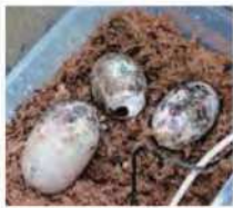
ニシアフリカコガタワニの卵

森の中に暮らす 小さなワニ ワニは水辺で暮らす、は虫類の仲間、世界の暖かい地方におよそ24種が生息しています。ニシアフリカコガタワニは、アフリカ西部、中央部の森の中にある小川や沼などで暮らしています。ワニとしては小型で、全長約1.5メートル、そのうち半分は尾の長さです。 このワニは肉食で、野生では魚、カニ、カエルやオタマジャクシなど、水辺の