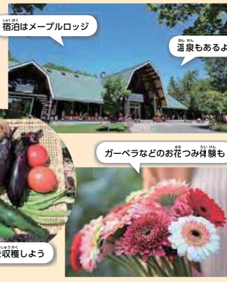
宿泊はメーブルロッジ 温泉もあるよ ガーベラなどのお花つみ体験も 新鮮な野菜を収穫しよう

岩見沢市内の農家さんで収穫体験をしたり、野菜ソムリエからブチレッスンを受けたりします。さらに、メーブルロッジでシェフの方からのお話を聞いたり、農家さんといっしょにご飯を食べたりもします! 体験内容は野菜の生育状況によって異なりますが、ブルーベリーのつみ取り体験やガーベラやヒマワリのつみ取り体験、ミニトマトやズッキーニのつみ取り体験、ジャガイモほり体験などを予定しています(その他の農作業体験になる場合もあります)。ぜひご参加ください!