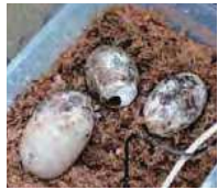
ニシアフリカコガタワニの卵

今月のどうぶつ ＊ニシアフリカコガタワニ ＊学名: Osteolaemus tetraspis tetraspis ＊生息地: 西アフリカから中央アフリカ ワニは水辺で暮らす、虫類の仲間、世界の暖かい地方に生息する24種が生息しています。ニシアフリカコガタワニは、アフリカ西部、中央部の森の中にある小川や沼などで暮らしています。ワニとしては小型で、全長の約半分の長さを占めます。このワニは肉食で、野生では魚、カニ、カエルやオタマジャクシなど、水辺の動物を食べています。