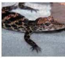
ニシアフリカコガタワニの手

いろいろな生き物を食べます。しかし、体が小さく、おとなしい性格なので、人間がおそわれることはないようです。 ワニは子育てをするは虫類として、は虫類としてはめずらしく、子育てをする習性があります。産卵をひかえたニシアフリカコガタワニの母親は、落ち葉などを集めて小さな山のような巣を作り、その中に10〜20個程度の卵を産みます。卵の大きさはワニの卵よりも少し大きいくらいです。