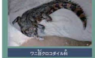
ワニ目クロコダイル科

学名: Osteolaemus tetraspis tetraspis 生息地: 西アフリカから中央アフリカ