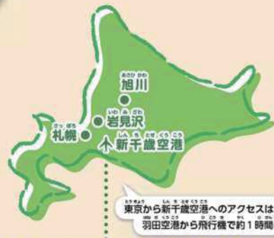
東京から新千歳空港へのアクセスは 羽田空港から飛行機で約1時間半

おいしい野菜を育てる農家さんを訪れて収穫体験をするなど、いろいろなツアーがあるよ。スーパーなどで売られている食品が、どのように育てられているのかを自分の目で見て、体験できるのって、すごくおもしろいし、楽しいよね!