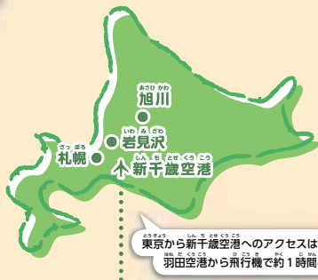
東京から新千歳空港へのアクセスは 羽田空港から飛行機で約1時間半

この夏は 北海道の大自然に飛び出そう! 今年の夏は、北海道の大自然にくり出してみたい? 東京都内ではできない、とびきりの体験が待っているよ!