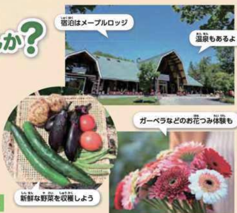
宿泊はメープルロッジ

※この広では旅行のお申し込みを承っておりません。 ※詳しい旅行条件を説明した書面(パンフレット)をお渡ししますので事前にご確認のうえお申し込みください。