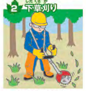
2 下草刈り 苗木に太陽の光が当たるよう、雑草を刈る