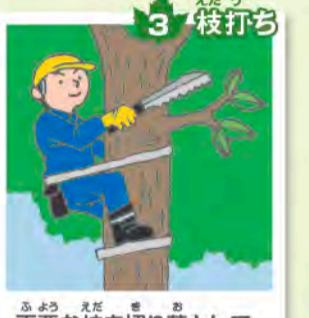
3 枝打ち 不要な枝を切り落とし、木をより元気に