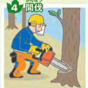
4 間伐 森の中に光が届くように、一部の木を間引く