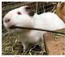
かたい枝をかじるモルモット

みんな同じ？ ネズミの仲間 姿や形、大きさも全く異なりませんが、モルモット(テンジクネズミ)とカビバラ、アフリカタテガミヤマアラシは、すべてげっ歯目に属するネズミの仲間です。げっ歯目の動物は、哺乳類の中ではもっとも種類が多く、1600種以上もいるといわれています。南極とニュージーランドを除く世界中に分布し、様々な環境に適応しています。