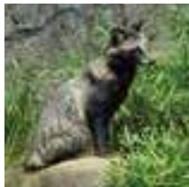
すっきりとした夏毛のタヌキ

身近な野生動物、タヌキ。日本昔話に出てきたり、かわいいキャラクターになっていたり、タヌキは私たちの生活の中で身近な存在です。生息している場所もとても身近で、北海道から九州まで、そして山の中から都会まで、日本のいろんな場所に暮らしています。