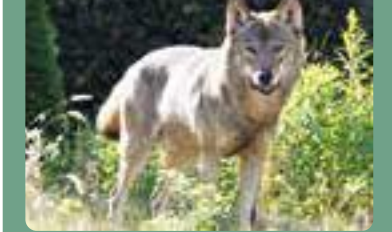
タイリクオオカミ: 食肉目イヌ科