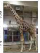
キリン同居準備中

2頭いっしょ 次の問題は、これまで 飼育していたオスのキリン 「ヒナタ」と仲良くできる かです。同じ種の動物で もいきなり同居させるとケ ンカをすることがありま す。