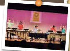
※写真は昨年の様子

カスタネットやタンバリン、マリンバなど、たくさん の打楽器が登場! 手作り楽器を配り、桐朋学園大学 打楽器科のお兄さん、お姉さんといっしょに演奏する コーナーもあるよ。この他にも、調布国際音楽祭で は、さまざまな公演が6月24日(日)~7月1日(日) の8日間に渡って開催。チェックしてみてね。