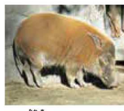
ブタの仲間のアカカワインシ(西園)

ブタじゃない? ツチブタは、アフリカのサハラ砂漠より南の草原などに広く生息しています。夜間に活動し、シロアリやアリを食べています。土をほることに優れた前肢をもつていて、ほととた巣穴で休んだり、子を育てたりしています。