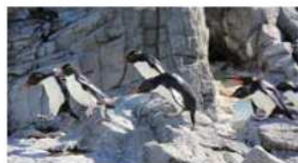
岩の上を飛び跳ねて移動する

ペンギン界のオシャレリーダー!? あざやかな赤い色の目にオレンジ色のくちばし。頭には黄色の長い羽が生えたミナミワトビペンギン。岩の上をジャンプしてジャンプと飛び跳ねるように移動することから、英語では「ロックホッパー」と呼ばれています。 このペンギンに、南極海の周辺にある寒い気候の鳥などで暮らしているため、暑いのは苦手です。水族園では、暑い時期は展示場ではなく、冷房が効いた飼育室で過ごすため、会えるのは秋から春の間です。また、夏の間には展示場が閉鎖され、秋には展示場で子ども(幼鳥)のミナミワトビペンギンを観察できます。子どもは頭に生える黄色い羽がとて短いので、大人(成鳥)と見分けることができず。展示場で子どもを見つけたら、大人と見比べてみてください。