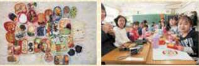
荒川区立第六日暮里小学校で行われた弁当の日の1コマ。自分の好きなものを形にしたり、大好きなものをたくさんつめたりと、「好き」が詰まった弁当を前にした、みんなの笑顔が印象的。

弁当の日というのは聞いたことはあるかな? これは、2001年に香川県の滝宮小学校が1人で弁当を作り、学校へ持っていき取り組みのこと。何をやるか決めるのも、買い出しも、調理も、弁当箱につめるのも、片付けも、すべて子どもたちが行うよ。全部自分で!? 包丁を使ったこともないのに...なんて不安になるかもしれないね。だったら、