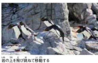
岩の上を飛び跳ねて移動する

ペンギン界のオシャレリーダー!? あざやかな赤い色の目にオレンジ色のくちばし。頭には黄色の長い羽が生えたミナミイワトビペンギン。岩の上をヒョコヒョコと飛び跳ねるように移動することから、英語では「ロックホッパー」と呼ばれ