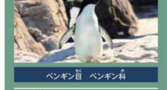
ペンギン目 ペンギン科