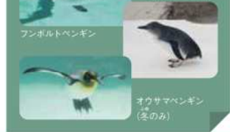
幼鳥は頭に生える黄色い羽が短い