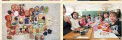
荒川区立第六日暮里小学校で行われた弁当の日の1コマ。自分の好きなものを形にしたり、大好きなものをたくさんつめたりと、“好き”が詰まった弁当を前にした、みんなの笑顔が印象的。

弁当の日、というのを聞いたことはあるかな? これは、2001年に香川県の滝宮小学校で始まった、子どもたちが1人で弁当を作り、学校へ持っていき取り組みのこと。何を作るか決めるのも、買い出しも、調理も、弁当箱に詰めるのも、片付けも、すべて子どもたちが行うよ。全部自分で!? 包丁を使ったこともないのに...なんて不安になるかもしれないね。だったら、