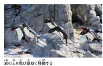
岩の上を飛び跳ねて移動する

ペンギン界のオシャレリーダー!? あざやかな赤い色の目にオレンジ色のくちばし。頭には黄色の長い羽が生えたミナミイワトビペンギン。岩の上をジャンプと飛び跳ねるように移動することから、英語では「ロックホッパー」と呼ばれ