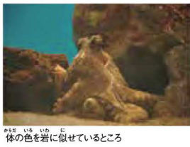
体の色を岩に似せているところ

日本でもっともポピュラーなタコ。マダコは日本で最もよく見られるタコの仲間です。沿岸の岩場に暮らしていて、岩のすき間や岩棚の下を巣穴としています。そして、巣穴の周りにいる貝類や甲殻類などをつかまえて、食べ終わったら後は巣穴の外に殻を捨てます。この習性を利用して、日本のがたこつぼ漁です。日本