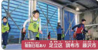
10/20(日) 渋谷区 複数会場あり 足立区 調布市 藤沢市

ミズノが教えるかけこ教室!運動会必勝塾 通算1500組以上の親子が参加した大人気体験。 4つのポイントでぐんと子どもが変わります。