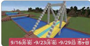
9/16(月)・9/23(月)・9/29(日) 市ヶ谷

裏高尾で不思議生物を造るささき隊長とミステリー生物調査隊 「高尾の物語」ともいえる場所でプロの自然解説者といっしょにさまざまな生き物・植物に出会えます。