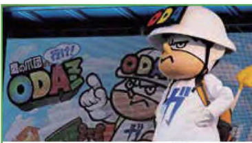
グローバルフェスタ(8ページを見てね)でODAマンに会おう!