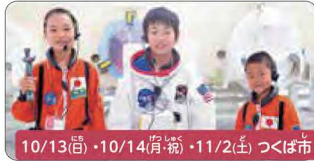
10/13(日)・10/14(月)・11/2(日) つくば市

プロといっしょにお菓子の家づくりケーキデザイナー体験 (ハウイン) プロのバイピング(絞り)テクニックを学びながら、自分らしいデコレーションをしていきます。