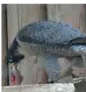
鶏頭を引きちぎって食べる

高速のハンター ハヤブサはタカなどの仲間と同じく、猛禽類と呼ばれています。よく見える目、高速で飛ぶ力、そして力強くするどいツメと口ばしを備えて、飛んでいるハトやムクドリなどの鳥を、たくみにとらえ