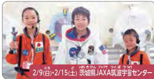
2/9(日)・2/15(土) 茨城県JAXA筑波宇宙センター

医学博士と長寿の秘密に迫る! キッズクワター体験 (循環器内科) 元・東京大学医学部附属病院のお医者さん、「血管のプロ」に学ぶ医療体験。リハビリの世界も体験します。