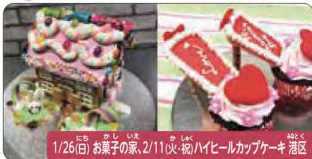
1/26(日) お菓子の家・2/11(水)ハイビルカップケーキ港区

プロといっしょにお菓子づくり! ケーキデザイナー体験 日本で数少ないプロのケーキデザイナーに絞りやデコレーションを学びながら楽しく作ります。