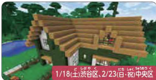
1/18(土) 渋谷区、2/23(日) 初中央区

宇宙兄さんズと宇宙ミッション体験! 本物の宇宙飛行士訓練施設(セキュリティエリア内)でミッション体験を行う特別なプログラム。