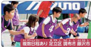
2/2(日) 複数日程あり 足立区 調布市 藤沢市

プロといっしょにお菓子づくり! ケーキデザイナー体験 日本で数少ないプロのケーキデザイナーに絞りやデコレーションを学びながら楽しく作ります。