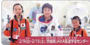
2/9(日)・2/15(土) 茨城県JAXA筑波宇宙センター

医学博士と長寿の秘密に迫る!キッズクワター体験(循環器内科) 元・東京大学医学部附属病院のお医者さん、「血管のプロ」に学ぶ医療体験。リハビリの世界も体験します。