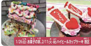
1/26(日) お菓子の家、2/11(火) 絵ハイルカップケーキ

プロといっしょにお菓子づくり/ケーキデザイナー体験 日本で数少ないプロのケーキデザイナーに絞りやデコレーションを学びながら楽しく作ります。