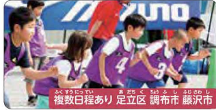
複数日程あり 足立区 調布市 藤沢市

プロといっしょにお菓子づくり/ケーキデザイナー体験 日本で数少ないプロのケーキデザイナーに絞りやデコレーションを学びながら楽しく作ります。