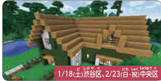
1/18(土) 渋谷区、2/23(日) 中央区

宇宙兄さんズと宇宙ミッション体験! 本物の宇宙飛行士訓練施設(セキュリティエリア内)でミッション体験を行う特別なプログラム。