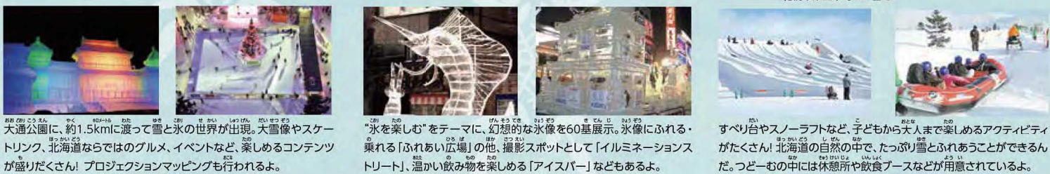
大通公園に、約1.5kmに渡って雪と氷の世界が出現。大雪像やスケートリンク、北海道ならではのグルメ、イベントなど、楽しめるコンテンツが盛りだくさん! プロジェクションマッピングも行われるよ。 “氷を楽しむ”をテーマに、幻想的な氷像を60基展示。氷像にふれる・乗れる「ふれあい広場」の他、撮影スポットとして「イルミネーションストリート」、温かい飲み物を楽しむ「アイスバー」などもあるよ。 すべり台やスノーラフトなど、子どもから大人まで楽しめるアクティビティがたくさん! 北海道の自然の中で、たっぷり雪とふれあうことができるんだ。つどいむの中には休憩所や飲食ブースなどが用意されているよ。